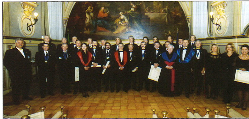
I neo-Accademici della Convocazione Accademica del 14 novembre 2003

È in discussione la quota associativa 2004 dell'AEREC. L'importo minimo di 150 Euro, che ciascun Accademico potrà integrare con un contributo supplementare libero, potrà essere corrisposto con assegno non trasferibile intestato ad AEREC ed inviato in busta chiusa ad AEREC, Via Sebino, 11 - 00199 Roma. Chi volesse, invece, fare un bonifico bancario dovrà intestarlo ad AEREC, Banca delle Marche - AG. 4 Roma - C/C n. 2350 cod ABI 6055 CAB 03205.