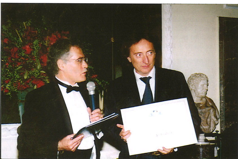
Premio alla Carriera conferito dall'AEREC al noto giornalista sportivo Amedeo Goria