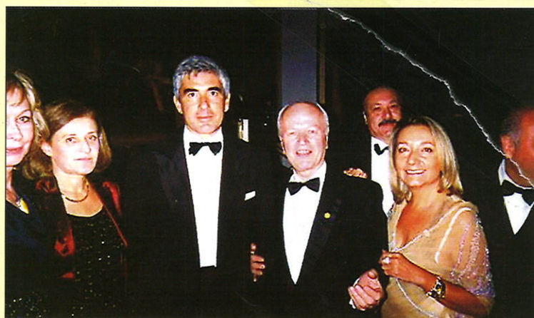
Alcuni membri della delegazione AEREC alla NIAF Convention di Washington con il Presidente della Camera On. Pierferdinando Casini